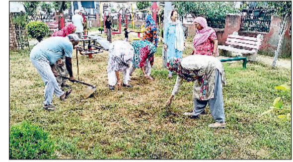
विद्यानगर स्थित पार्क की सफाई करते हुए व पार्क में लगा ट्रांसफार्मर।

पार्क के बीचों बीच लोहे की स्ट्रीट लाइट का पोल से भी हादसे की आशंका