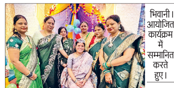
भिवानी। आयोजित कार्यक्रम में सम्मानित करते हुए।

महिलाओं के बीच आपसी सौहार्द व सहयोग की भावना को बढ़ावा देना था कार्यक्रम का उद्देश्य