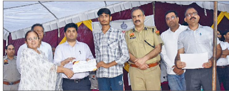
भिवानी। रात्रि ठहराव के दौरान एक प्रतिभागी को सम्मानित करते हुए।