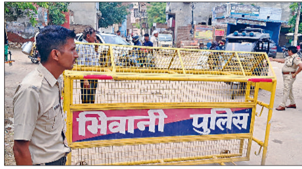
भिवानी। यातायात व्यवस्था पट्टी पर लाने के लिए शहर में की गई नाकाबंदी व परीक्षा केंद्र के बाहर उपस्थित परीक्षार्थी।

बुधवार को हरियाणा विद्यालय शिक्षा बोर्ड की अध्यापक पात्रता परीक्षा के आयोजन वक्त जबरदस्त सुरक्षा व्यवस्था रही। परीक्षार्थियों की बारीकी से जांच करके ही परीक्षा केंद्र के अंदर प्रवेश मिला। यहां तक कि महिला परीक्षार्थियों के नाक का मोती व कानों की बाली तथा पुरुष परीक्षार्थियों के हाथों के कलावा, बेल्ट खुलवाई। यहां तक कि कई परीक्षार्थियों के जूते व जुराब निकलवा कर पूरी तरह से जांच पड़ताल की। यह सारी प्रक्रिया की वीडियोग्राफी हुई। साथ में परीक्षा केंद्रों पर लगे सीसीटीवी कैमरों में दर्ज होती रही। मुख्य द्वार से प्रवेश मिलने के बाद परीक्षार्थियों की मोबाइल कैमरे से फोटो खींचा गया और फार्म के साथ लगे फोटो के साथ मिलान किया गया। फोटो का मिलान होने के बाद ही परीक्षार्थी को परीक्षा भवन तक भेजा गया। इस दौरान पुलिस सुरक्षा रही। परीक्षार्थी के अलावा किसी अन्य व्यक्ति को परीक्षा केंद्र के नजदीक तक नहीं फटकने दिया। परीक्षा के शुरू होने से लेकर खतम होने तक जबरदस्त सुरक्षा व्यवस्था रही। इससे पहले पुलिस व सुरक्षा एजेंसी द्वारा रोलनम्बर के अलावा एक अन्य आईडी की जांच के बाद ही परीक्षार्थियों को मुख्य द्वार से अंदर भेजा गया। परीक्षा के शुरू होने के बाद ही परीक्षार्थियों को मुख्य द्वार से अंदर भेजा गया। परीक्षा के शुरू होने के बाद ही परीक्षार्थियों को मुख्य द्वार से अंदर भेजा गया। परीक्षा के शुरू होने के बाद ही परीक्षार्थियों को मुख्य द्वार से अंदर भेजा गया।