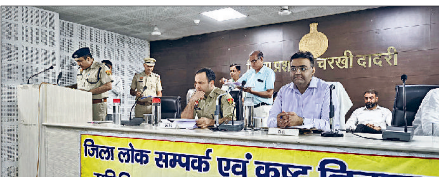
चरखी दादरी। चरखी दादरी में आयोजित कष्ट निवारण समिति की बैठक में परिवाद सुनते हुए।