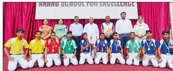
गांव मिलकपुर के आनंद स्कूल फॉर एक्सीलेंस में विजेता खिलाड़ियों के सम्मान में भव्य समारोह का आयोजन में सम्मानित करते हुए।

शाही लकड़हारे सांग का मंचन कर आए हुए दर्शकों को मंत्रमुग्ध किया। इस सांग में बताया गया ईसान पर कितना भी बुरा समय आ जाये पर उसको कभी भी धर्म के रास्ते को नहीं छोड़ना चाहिए क्योंकि जीत हमेशा सत्य की होती है जो ईसान विपरीत परिस्थिति में भी धर्म के मार्ग को नहीं छोड़ते तो उनको कोई हरा नहीं सकता।