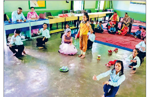
भवानीखेड़ा। भवानी खेड़ा के वीर शहीद कपिल देव राजकीय मॉडल संस्कृति वरिष्ठ माध्यमिक विद्यालय में खंड स्तरीय सांस्कृतिक कार्यक्रम में प्रस्तुति देते हुए विद्यार्थी।

करीब मजदूर ऑफलाईन व चार लाख के करीब आनलाईन पंजीकृत हुए हैं। लगभग छह हजार करीब रूपए जमा होने के बावजूद लाभ से मजदूर वंचित किया जा रहा है और कहा कि श्रम मंत्री के आदेशानुसार विभाग द्वारा सभी निर्माण मजदूरों का पंजीकरण अस्थाई तौर पर 4लॉक कर दिए गये हैं। कारण यह दिया गया है कि फर्जी तरीके से 90 दिन की वैरीफिकेशन की गई है।