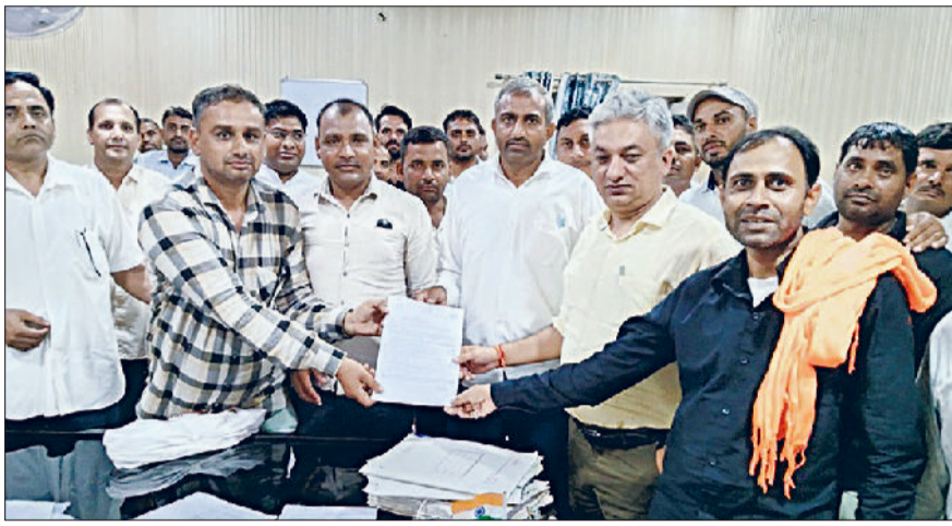
भिवानी। मांगों को लेकर ज्ञापन सौंपते हुए।

सभी सब डिवीजन में प्रत्येक कंस्ट्रेंट सेंटर पर अनुबंधित कर्मचारियों के साथ रेगुलर कर्मचारी की ड्यूटी सुनिश्चित की जाए। आपके डिजिटल के अंतर्गत कार्यरत अनुबंधित कर्मचारियों का एलडब्ल्यूएफ का पैसा नहीं हुआ जिसके कारण अनुबंधित कर्मचारी एलडब्ल्यूएफ योजना का लाभ लेने से वंचित रह गये, जिसकी वजह से कर्मचारियों की विधवाओं को पेंशन का लाभ नहीं मिल रहा है। ठेकेदार द्वारा 2018 से 2021 तक का एलडब्ल्यूएफ का पैसा जमा नहीं करवाया गया है