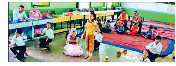
बवानी खेड़ा के वीर शहीद कपिल देव राजकीय मॉडल संस्कृति वरिष्ठ माध्यमिक विद्यालय में खंड स्तरीय सांस्कृतिक कार्यक्रम में प्रस्तुति देते हुए विद्यार्थी।