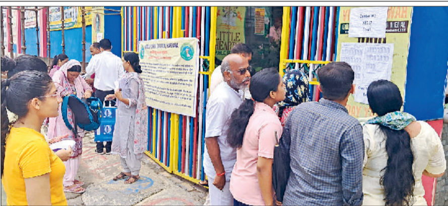
भिवानी। परीक्षा केंद्र के बाहर सीटिंग प्लान देखते परीक्षार्थी।

किसी तरह की अप्रिय घटना से बचने व यातायात व्यवस्था पट्टी पर रखने के लिए हर चौक चौराहों पर पुलिस बल तैनात रही। नाकाबंदी करके वाहनों को लाइन में निकाला। हालांकि जिस वक्त परीक्षा खतम हुई उस वक्त एक बारगी तो सड़कों पर जाम की स्थिति बन गई लेकिन पुलिस की चौकसी के चलते वाहनों का आवागमन पूरी तरह से होता रहा। इस दौरान पुलिस ने किसी भी वाहन को आड़ा तिरछा नहीं खड़ा होने दिया। जो परीक्षार्थी वाहन लेकर परीक्षा केंद्र तक पहुंचा। उसके वाहन को बाहर को ही फुटपाथ पर खड़ा करवा दिया। ताकि वाहनों के आने